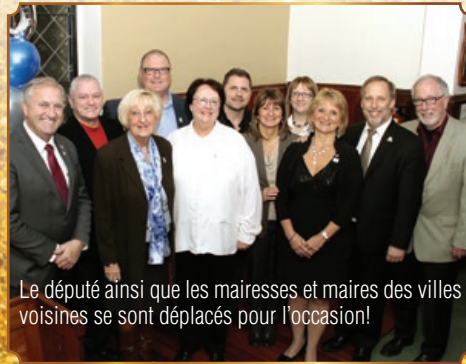
Le député ainsi que les mairesses et maires des villes voisines se sont déplacés pour l'occasion!