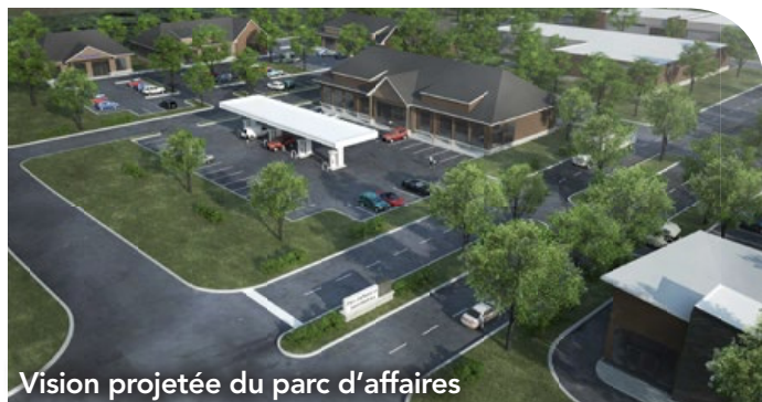
Vision projetée du parc d'affaires

Des rencontres sont en cours avec le promoteur afin de définir les différentes étapes du développement de la phase 1 du parc d'affaires qui est la construction d'une station-service et restauration rapide!