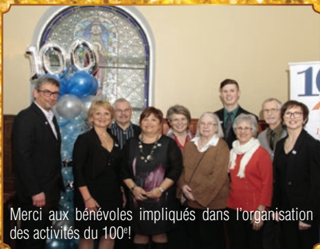
Merci aux bénévoles impliqués dans l'organisation des activités du 100 e !