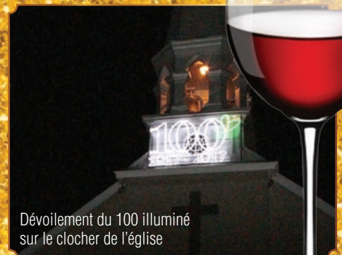
Dévoilement du 100 illuminé sur le clocher de l'église