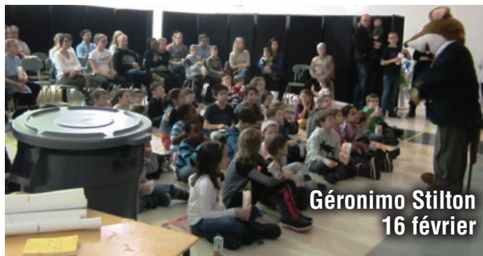
Géronimo Stilton 16 février

Plus de 85 personnes ont assisté au spectacle gratuit de Geronimo Stilton! Les cadeaux de participation et la signature d'autographes, à la fin du spectacle, ont fait plusieurs heureux!