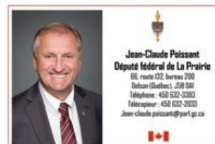
Jean-Claude Poissant Député fédéral de La Prairie 666, route 132, bureau 200 Dorval (Québec), J5B 0A6 Téléphone : 450 652-3283 Télécopieur : 450 652-2033 Jean-claude.poissant@parl.gc.ca